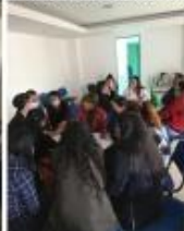
Grupo Aquitania - Sogamoso