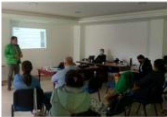
Saludo a los participantes por parte del Alcalde