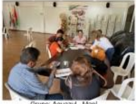
Grupo: Aguazul - Mani