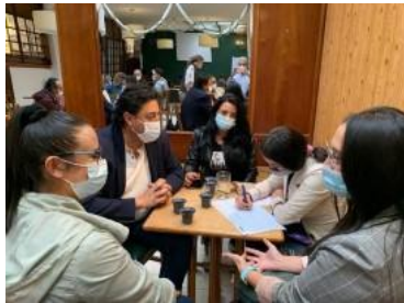
Grupo 1.Sogamoso- Aquitania Pajarito