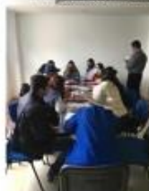
Grupo Aquitania – Pajarito