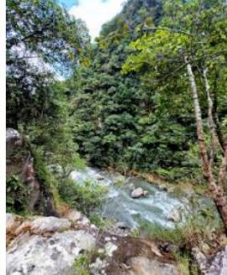
Río Cravo Sur