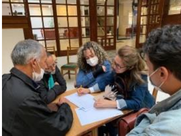
G3. Sogamoso- Aquitania- Pajarito- Aguazul