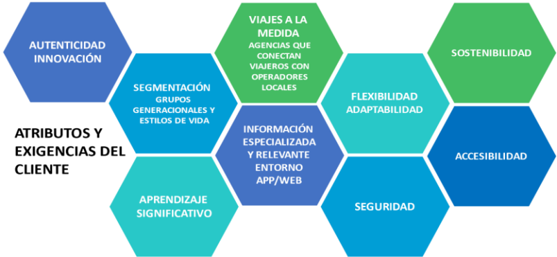
Gráfica 2. Atributos y características valorados por los clientes potenciales