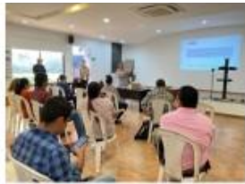
Presentación por parte equipo consultor