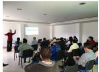
Presentación por parte equipo consultor