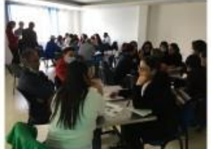
Mesas de trabajo