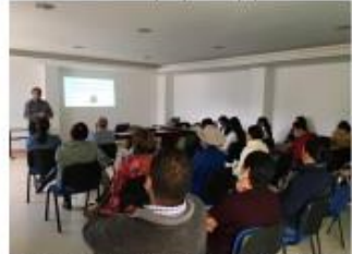
Presentación Manual Protocolos y Servicios