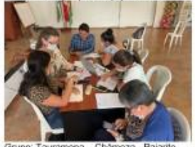
Grupo: Tauramena – Chámeza - Pajarito