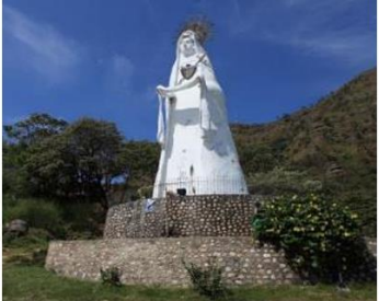
Virgen de Manare