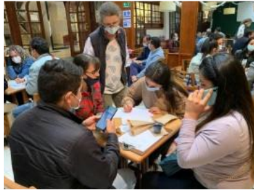
Grupo 2.Sogamoso- Aquitania - Labranzagrande