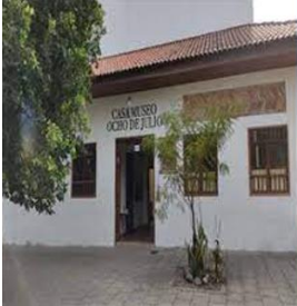
Casa Museo 8 de julio

En Sogamoso, capital de la Provincia de Sugamuxi, se puede realizar un recorrido histórico que se remonta a los ancestros Muisca, con cada relato se podrán encontrar detalles sobre su mitología y su cultura, además de caminar al encuentro del agua en la laguna de Siscunsi y el Lago de Tota, en Aquitania, donde se ubican sus complejos paramunos. También se podrá compartir con sus pobladores a través de tradiciones agrícolas, como el tejido de ruana y el cultivo de la cebolla larga.