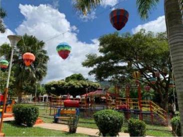
El Morro – Plaza central