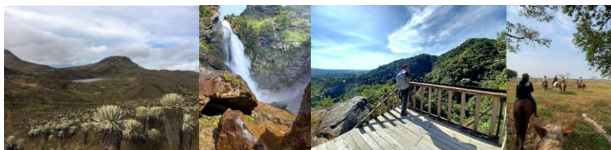
Fotos: Laguna Siscunsi, Salto Candelas, Balcones del Cacique, Trabajo de llano

A partir del análisis de la información del inventario de recursos y atractivos turísticos (103 fichas), la evaluación de impactos y sostenibilidad, el análisis de oferta y demanda turística y la conceptualización de la Ruta Turística de la Cuenca del Río Cusiana, se priorizaron unos atractivos focales y complementarios en función de argumentos temáticos que permitan crear una oferta diferenciadora.